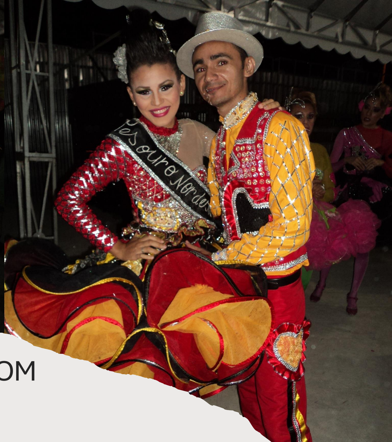
CASAL DE NOIVOS E RAINHA COM SEU PAR 2013