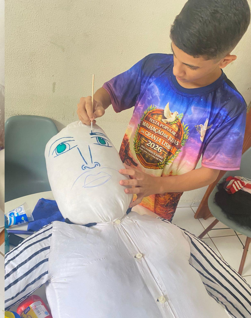
Oficina de Confecção De Bonecos (3h\A)